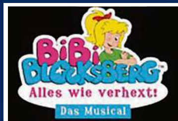
Bibi Blocksberg - Alles wie verhext! Das Musical 27.10.2024 – Westand BS