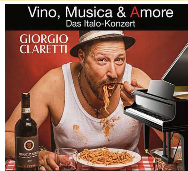
Vino, Musica & Amore 23.08.24 - Heinrich Wirtshaus BS