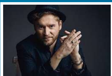
Johannes Oerding 17.08.2025 – BraWo Bühne BS