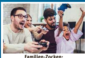
Familien-Zocken: Das Eltern- und Familienevent 29.06.2024 - FORUM Medienhaus Braunschweig