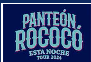
Panteón Rocoó 27.08.2024 – Hallenbad Wolfsburg