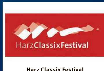
Harz Classix Festival 20. & 27.09., 23.11.24 – Clausthal Zellerfeld