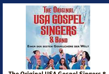
The Original USA Gospel Singers & Band 04.12.2024 – Westand BS

www.konzertkasse.de und in unseren Konzertkassen vor Ort