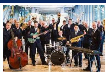
Polizei Big Band Niedersachsen 23.08.2024 - Freundschaftsbühne BS