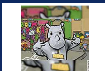
DIKKA 06.10.2024 – CongressPark Wolfsburg