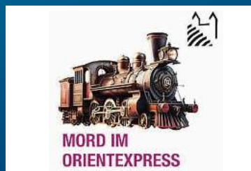
MORD IM ORIENTEXPRESS Mord im Orientexpress Ab 21.06.24 – Domfestspiele BG