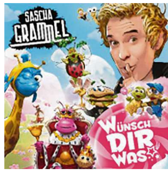
Sascha Grammel 08.09.2025 – CongressPark Wolfsburg