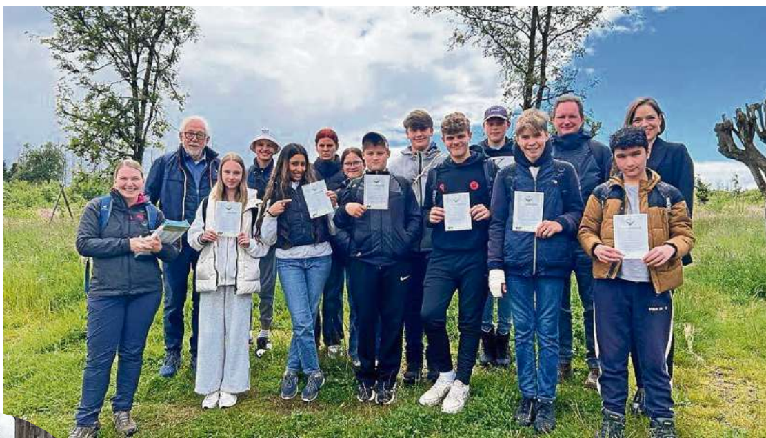
Die siebte Klasse der Albert-Schweitzer-Hauptschule in Vechelde hat den Zeitungswald-Wettbewerb und damit einen Tag im Harz gewonnen. Unterstützt wurde die Aktion von der Achterkerke Stiftung.

Den Schülern der siebten Klasse der Albert-Schweitzer-Hauptschule in Vechelde war bereits bewusst, dass der Wald im Harz stark durch den Borkenkäfer zerstört wurde. Denn, die Klasse hat im Rahmen des Zeitungswald-Wettbewerbs das Projekt „Unser Wald – Multimedial“ erstellt. In Kooperation mit einer Forstwirtin und Waldpädagogin aus dem Nachbarort Wahle haben die