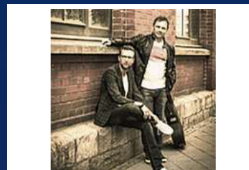
Simon & Garfunkel Revival Band 26.07.2024 – Schlosspark Vechelde