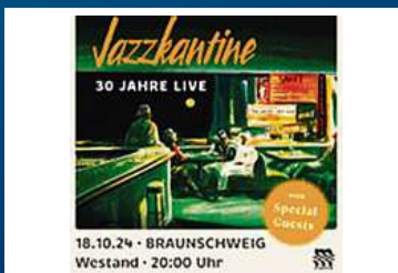
Jazzkantine – 30 Jahre Live 18.10.2024 – Westand BS