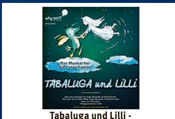
Tabaluga und Lilli - Das Musical für die ganze Familie 24.10.2024 – CongressPark Wolfsburg